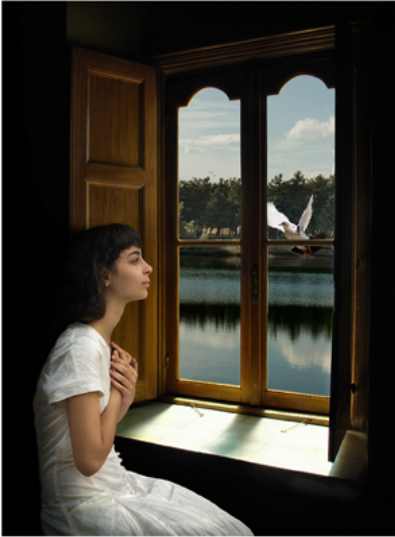
The Messenger, 2006