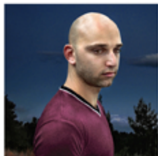
“The Hunter II”