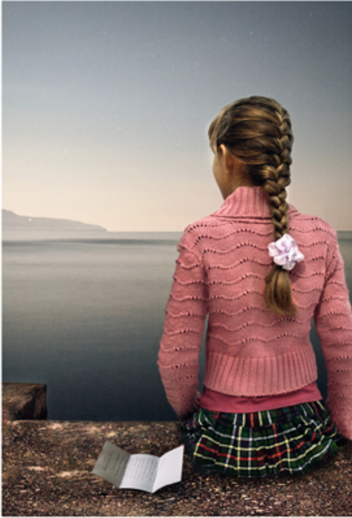
The Letter, 2007