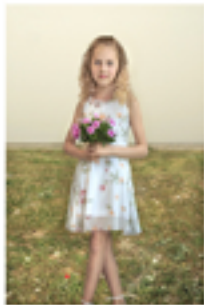
“Girl with flowers”