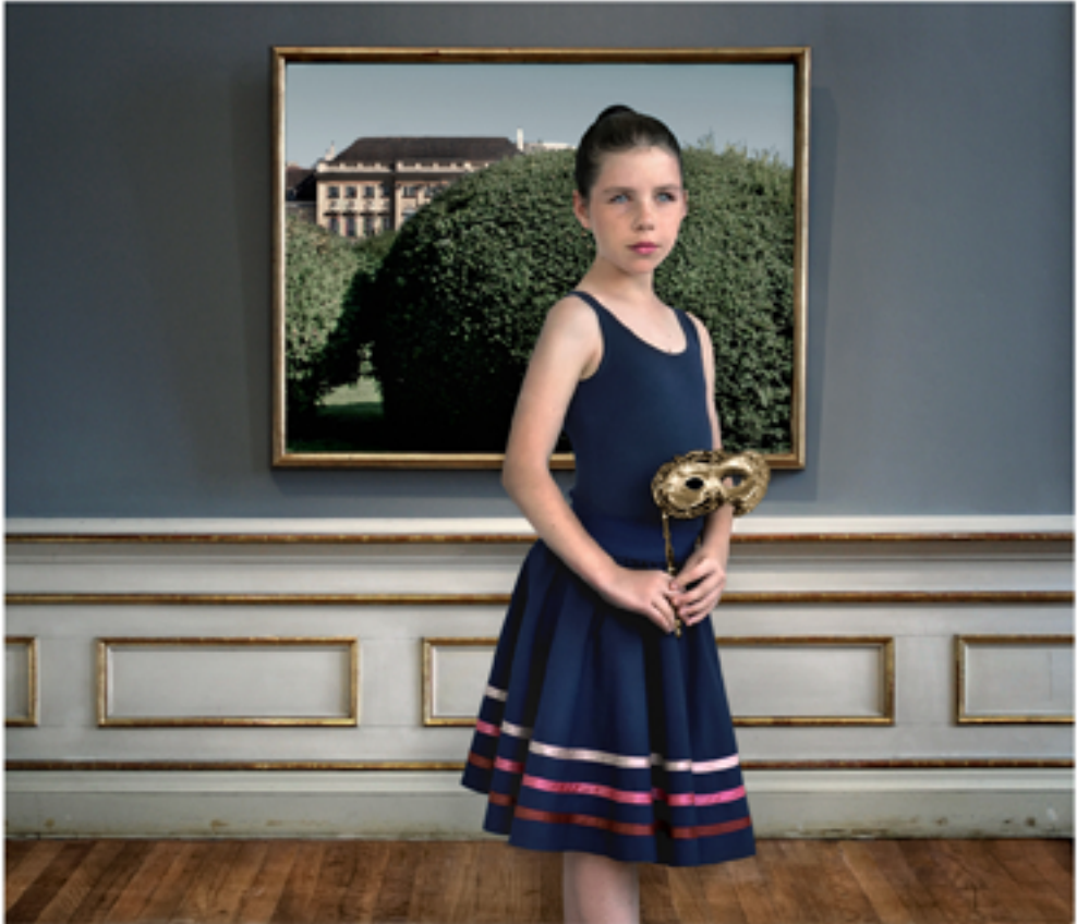
The Guest, 2007