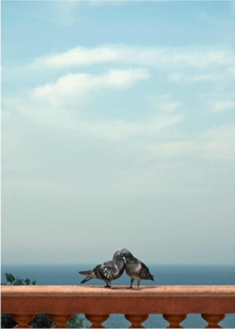
The Kiss, 2008