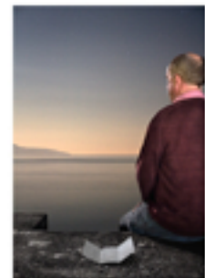
“The Letter II”